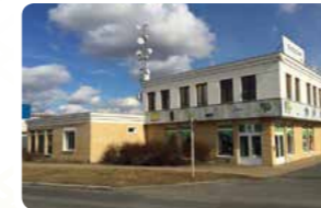
Centrála PLZEŇ Headquarters Plzeň

Tel: +420 377 221 177 E-mail: info@discomp.cz