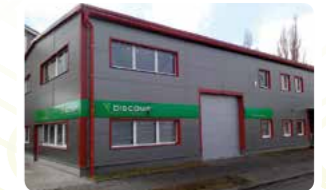
Pobočka OSTRAVA Branch office Ostrava

Discomp s.r.o. Rybářská 15 OSTRAVA – Mariánské Hory 709 00